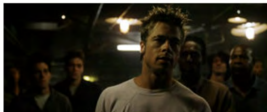
„Eine Arbeit zu machen, die wir hassen...“ Foto: Brad Pitt in Fight Club

Was wir anzubieten haben, ist Freiheit und Solidarität. Nein, ein solidarischer Individualismus ist keine Widerspruch, wir sind der Überzeugung, dass es eine Gesellschaft geben kann, „worin die freie Entwicklung eines jeden die Bedingung für die freie Entwicklung aller ist“ ( Karl Marx, 1848 ). Und darum nennen wir einen Krieg immer noch einen Krieg und halten Armut und Ausgrenzung immer noch für einen