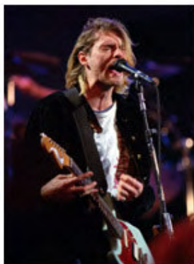
„Generation X“ Foto: Curt Kobain, Nirvana

Wir sind nicht mehr länger die Generation X , die den Partei- und Wirtschaftsführern zuruft: „Here we are now, entertain us“ ( Nirvana ). Wir waren schon bei den Ärzten und sind immer noch für Visionen. Aber das ewig uneingelöste Versprechen der Vollbeschäftigung haben wir nicht mehr anzubieten.